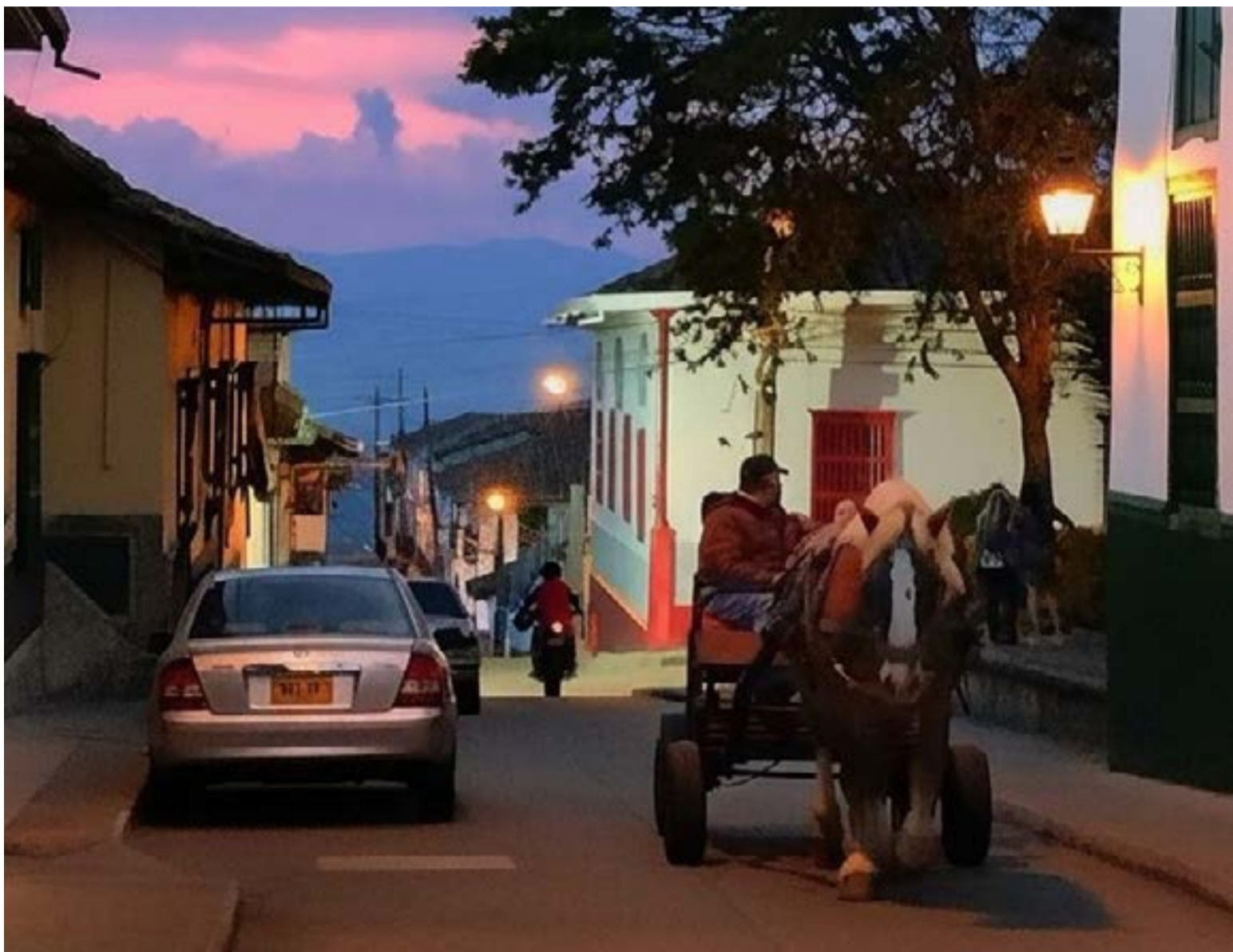
Bajo la atmósfera de un «nocturno colorido» y en relativa calma como se aprecia en Sonsón, Antioquia, el país transita los días previos a la jornada electoral. Colombia aguarda con expectativa los comicios de la primera vuelta presidencial, en un ambiente que busca preservar la «tranquilidad democrática» en todo el territorio nacional.