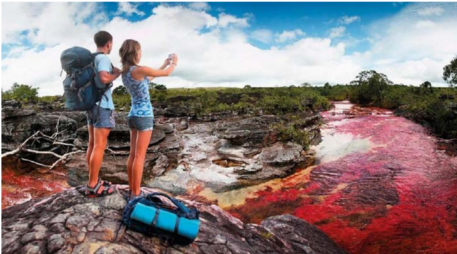
Colombia «el País de la Belleza».