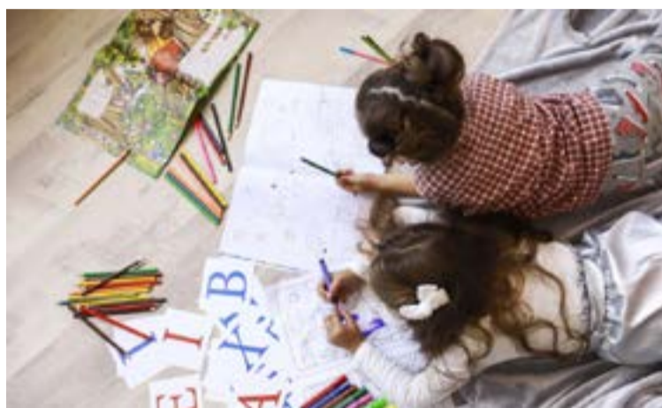
Nuestros menores necesitan respuestas rápidas ante el deterioro de su bienestar emocional.

En el Cesar, las cifras ofrecen un matiz agri dulce. Al cierre de la semana epide-