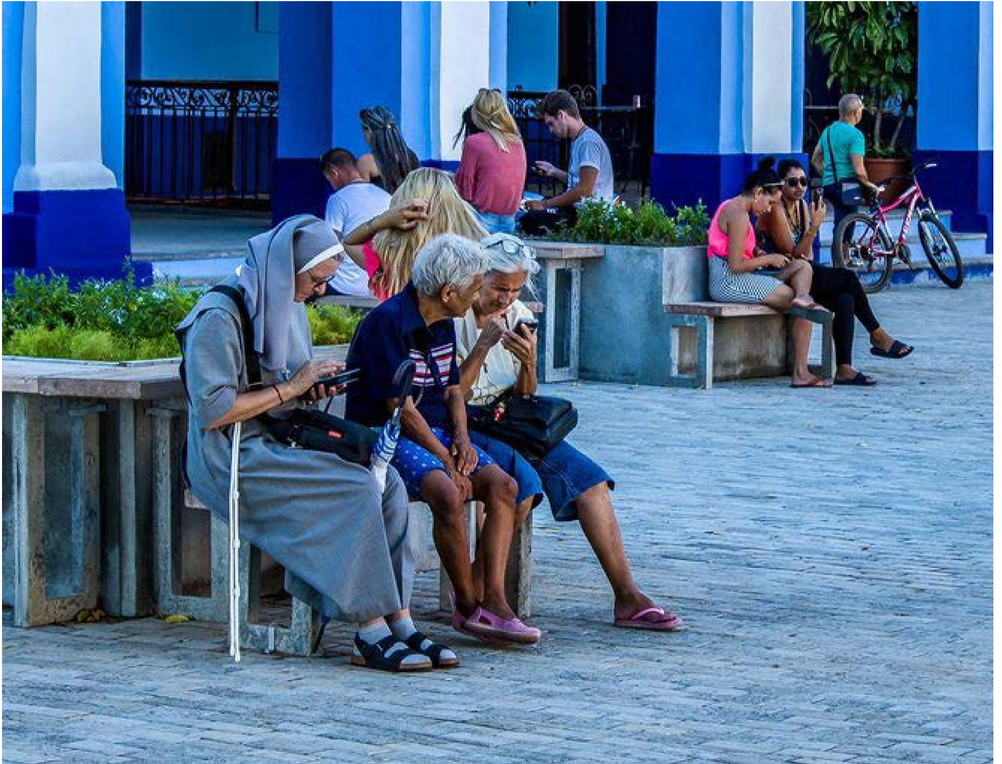
Conéctate Señor.